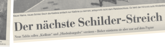
Die Stadtverwaltung hat am Freitag neue Namenslisten an der Kiellinie aufgehängt.

Der nächste Schilder-Streich Neue Tafeln sollen „Kiellinie“ und „Hindenburgufer“ vereinen – Bisher existieren sie aber nur auf dem Papier