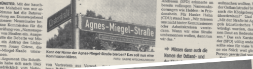
Kann der Name der Agnes-Miegel-Straße bleiben? Das soll nun eine Kommission klären.

Stadt lässt Straßennamen überprüfen Ratsversammlung stimmt für Einsetzung einer Kommission aus Verwaltung, Politik und Historiker