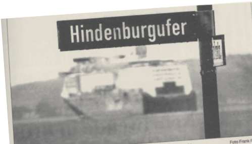
Promenade mit Föhrdeick: Die Schilder mit dem Namen Hindenburg werden bald abgeschraubt.

Mehrheit steht: Neuer Name für Kieler Hindenburgufer Vorzeige-Promenade soll Kiellinie heißen – Auch Ehrenbürgerwürde wird aberkannt Kiel. Nach monatelanger Debatte ist das Aus für das Hindenburgufer in Kiel jetzt beschieden. Die Promenade soll Kiellinie heißen. Auch die Ehrenbürgerwürde von Adolf Hitler wird aberkannt.