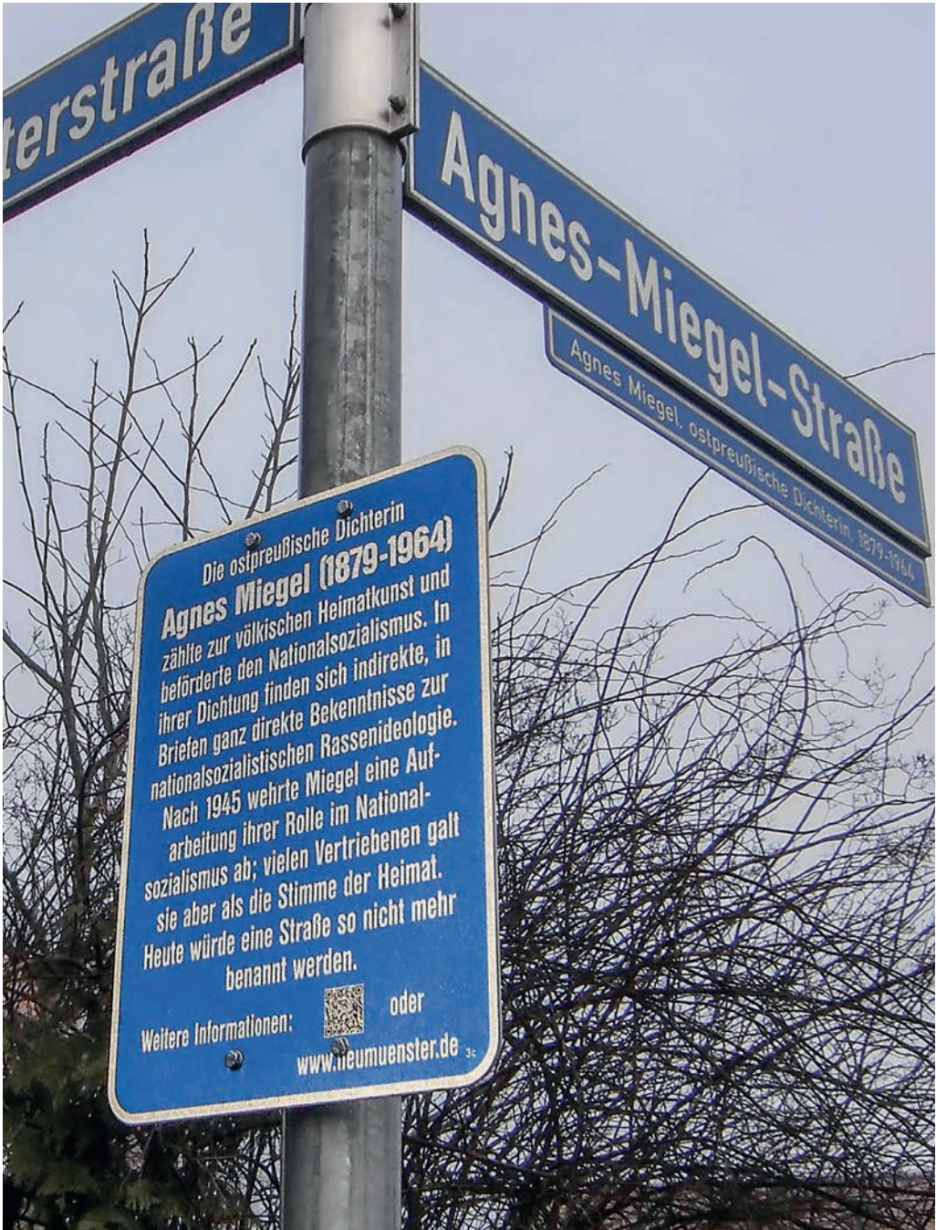
Straßenschild mit Erläuterungsschild der „Agnes-Miegel-Straße“ in Neumünster.

Das geschichtskulturelle Experiment soll nach fünf Jahren evaluiert und die Debatte um Umbenennungen neu aufgerufen werden. Man darf gespannt sein.