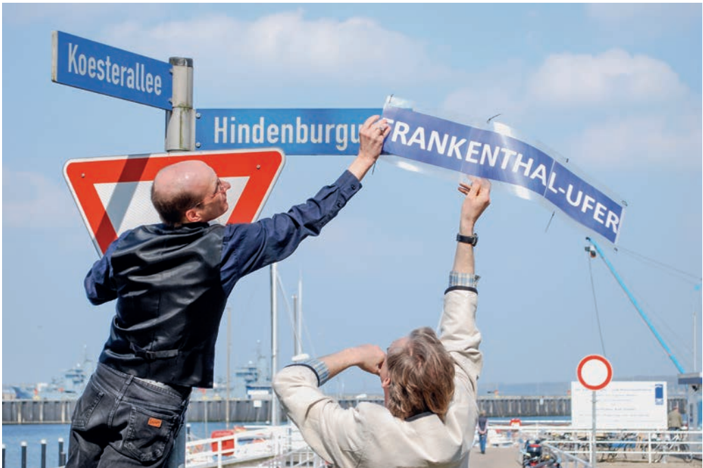
Symbolische Umbenennung des Kieler Hindenburgufers durch den Akens am 18. April 2010.

Bezogen auf die ostpreußische Autorin Agnes Miegel scheint die Antwort der Geschichtswissenschaft recht klar: Miegel war nicht nur Mitläuferin, sondern überzeugte und agierende Nationalsozialistin, die nach 1945 keinerlei Reflexion, Einsicht oder Läuterung zeigte. Deshalb plädieren Steffen Stadthaus 22 und Thorsten Harbeke 23 ausdrücklich für Namenskorrekturen.