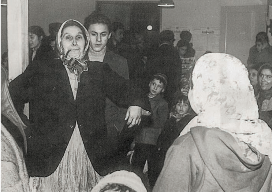
Nachdem der Schock nach dem Polizeieinsatz gewichen war, verbreiteten sich neben Ungewissheit auch Erleichterung unter den Reisenden.