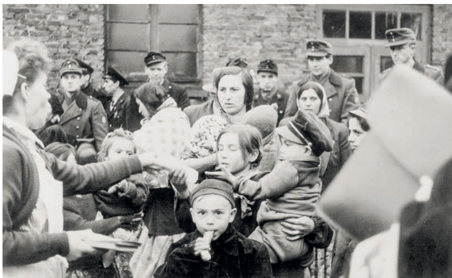
Schwester des Roten Kreuzes verteilen Lebensmittel an die angekommenen Roma aus Polen. Im Hintergrund bewachen Beamte des Bundesgrenzschutzes aufmerksam die Reisegruppe.

lichen Erfassungsbogen an, fertigten Lichtbilder an und Ärzte des Gesundheitsamts Ratzeburg führten Untersuchungen auf ansteckende Krankheiten durch. 11 Die Landespolizei konnte dabei auf interne Experten zurückgreifen, die schon seit Jahrzehnten und systemübergreifend in der gesonderten Erfassung von Sinti und Roma geübt waren. Tätigkeiten, die im Massenmord an der Romabevölkerung im Deutschen Reich und in vielen besetzten Teilen Europas gegipfelt hatten. 12 Die nach 1945 nun Landfahrerüberwachung genannte verdachtsunabhängige Sondererfassung wurde durch die Landespolizei Schleswig-Holstein nach kurzer – durch die britische Besatzungsmacht initiiertes – Zurückhaltung bereits 1948 wieder begonnen. Bundesweit einigten sich die Vertreter der Kriminalpolizeien der Länder bereits im September 1949 darauf, den Begriff „Zigeuner“ durch „Landfahrer“ zu ersetzen, um nicht in den Verdacht zu geraten, eine Bevölkerungsgruppe aus rassistischen Gründen zu verfolgen. 13 In Schleswig-Holstein galten polizeiliche Sonderregeln zur Überwachung von „Landfahrern“ – wenn auch ohne Gesetzesgrundlage wie etwa in Bayern – bis 1977. Am 21. August 1948 trat ein Erlass zur „Bekämpfung des Zigeunerunwesens“ in Kraft, der am 14. September 1957 um einen Erlass zur „Bekämpfung des Landfahrerunwesens“ ergänzt wurde. 14