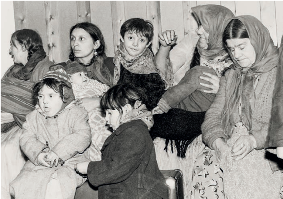
Familien in großer Enge in den Räumlichkeiten der Bahnhofsmission. Für die tagelange Unterbringung Hunderter Menschen gab es insbesondere keine ausreichenden Kapazitäten der sanitären Anlagen.