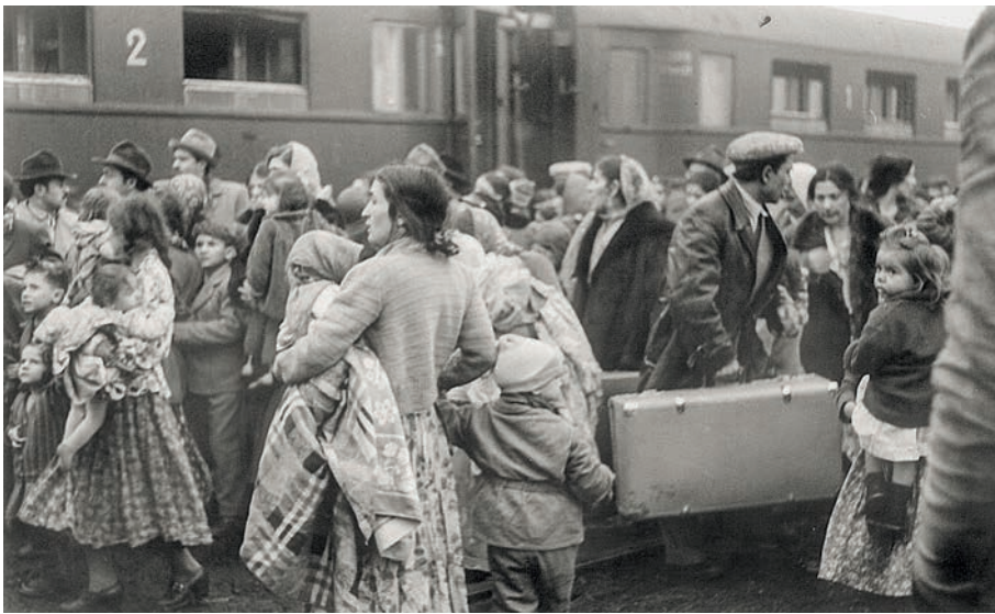
Chaotische Szenen auf dem Bahnhof Büchen: Panik und Angst verbreiteten sich bei den Roma-Familien vor einer Abschiebung über die Zonengrenze zurück nach Polen.

Die Registrierung der Menschen durch das Passkontrollamt Hamburg und die Lübecker Kriminalpolizei startete am 19. Februar. Diese legten für jede Person einen erkennungsdienst-